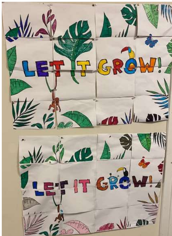
De leerlingen van de A-klas hebben deze puzzeltekening gemaakt.

We wensen u allen fijne feestdagen en hopen dat het nieuwe jaar u veel moois zal brengen.